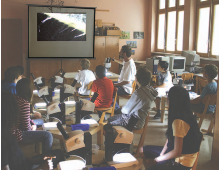
Abb. 5: Gemeinsames Betrachten und Auswerten eines Präparates mittels Videokamera und Beamer.

che Helfen, Pflegen, Assistieren und Erziehen, Jungen für naturwissenschaftlich basierte, technische oder gewerbliche Studienfächer oder Berufe.