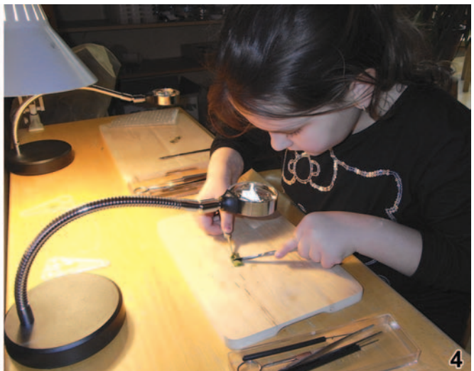
Abb. 3: Orientierender Blick durch das Stereomikroskop. – Abb. 4: Präparation mit Hilfe der Standlupe.