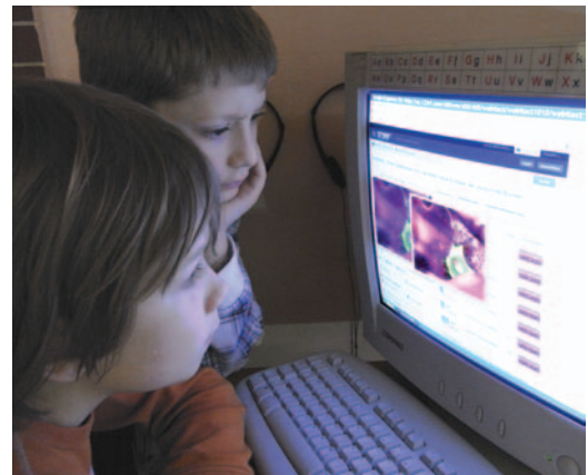
Abb. 6: Zeitgemäße Internet-Recherche zur Beantwortung von Fragen.

Unbekanntes oder besonders Interessantes, so kommt es damit zu mir. Das Objekt wird sodann unter die mit einer Digitalkamera ausgestattete Stereolupe (Leica EZ4 HD, Vergrößerung 8- bis 35fach) gelegt oder für das digitale Durchlichtmikroskop (Leica DM750 + ICC50 HD, Vergr. bis 1000fach) präpariert und mittels Beamer für alle sichtbar auf einer Leinwand abgebildet (Abb. 5). Es folgt daraufhin eine Erklärung entweder durch das betreffende Kind oder durch mich. Offene Fragen werden durch sofortiges Nachforschen in den bereitliegenden Büchern und Karteien oder im Internet zu beantworten versucht (Abb. 6). Von Zeit zu Zeit