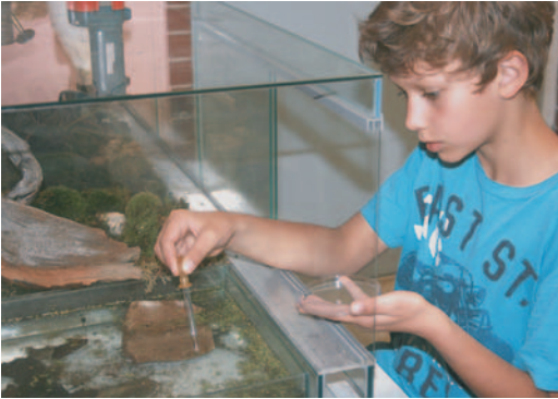
Abb. 7: Überraschungen aus dem Kaulquappen- und Moorbecken.

bekommen die Kinder eine Powerpoint-Präsentation gezeigt, worin ganz allgemeine, basale Themen zur Sprache kommen, wie Anatomie und Morphologie von Spinnen, Fliegen, ausgewählten Pflanzen, die Metamorphose des Marienkäfers oder des Frosches, um nur einige Beispiele zu nennen.